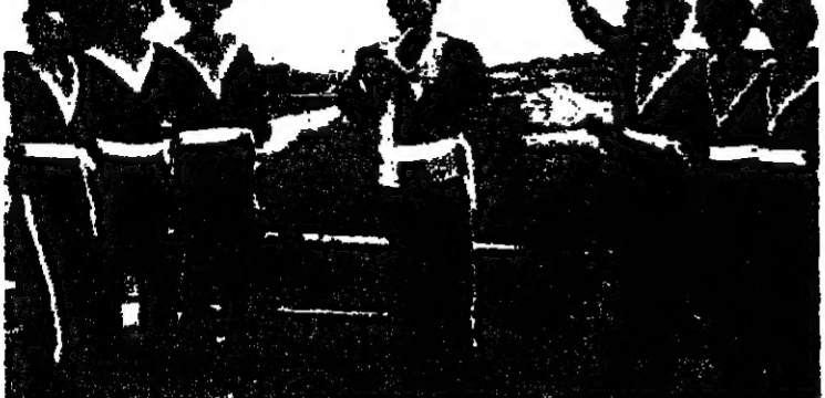
فرقة الرقص الشعبي للصغار في دالية الكرمل